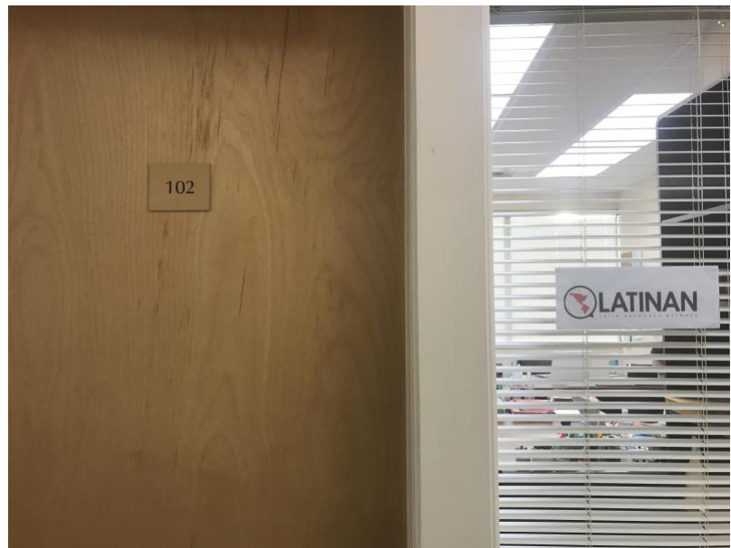
Despacho Latinan, sede Salinas