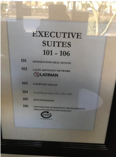
Directorio del edificio donde se ubica Latinan