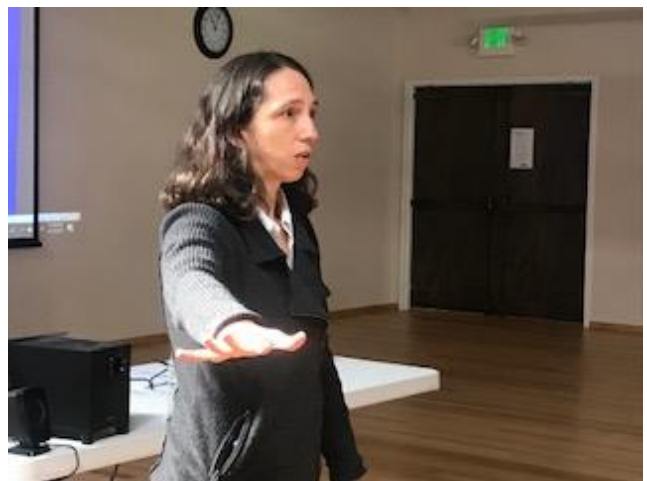
Taller sobre derechos humanos de las personas en contexto de migración, Latinan en colaboración con SEIU.UHW, organización regional aliada