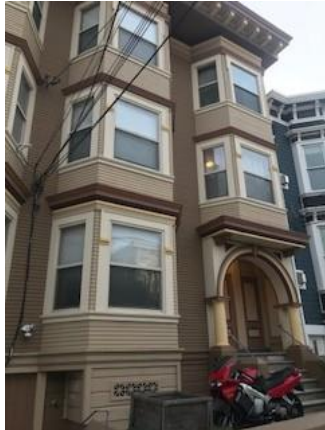
Sede de Latinan en San Francisco

Las fotografías insertas a continuación fueron tomadas con autorización de la organización visitada. De forma que es notable tomar en consideración que dado que no se obtuvo su consentimiento para retratar las entrevistas con los solicitantes de asilo y demás personas en contexto de migración suys entrevistas fueron presenciadas por la visitante profesional, no se integra alguna relacionada con esa actividad.