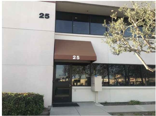
Puerta principal del edificio