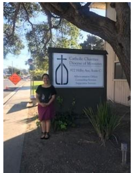
Visita a Catholic Charities, organización aliada regional de Latinan