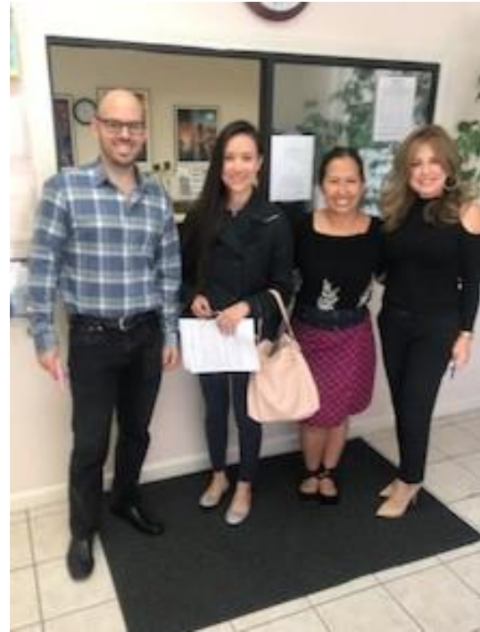
Reunión con integrantes de California Rural Legal Assistance, aliados regionales de Latinan