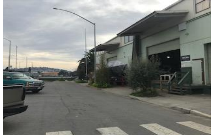
Lugar de trabajo de un cliente donde se realizó su entrevista