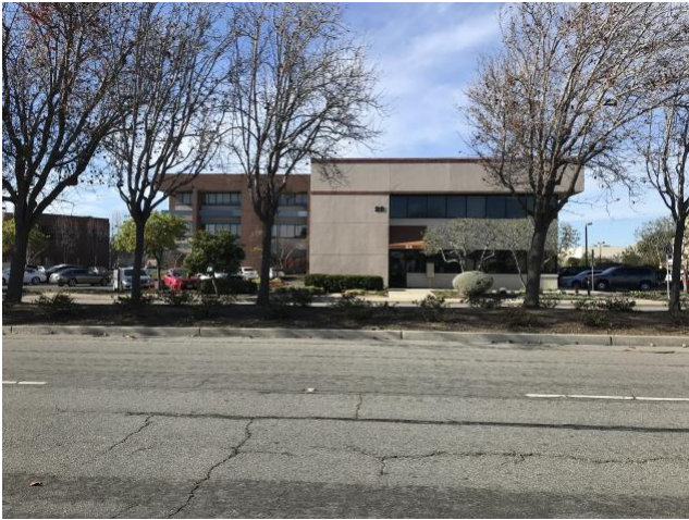
Instalaciones de Latin Advocacy Network en Salinas